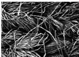
Katoen (76 x vergroot)

Dermasilk® verbandzijde is de enige natuurlijke vezel (800-1200 meter lang) die volledig glad is waardoor het materiaal niet irriteert. Dermasilk® verbandzijde is vervaardigd van 100% ongebleekte, ongeverfde natuurzijde. Dermasilk® verbandzijde beschermt de huid tegen beschadiging door krabben en door textiel, waardoor bij gebruik roodheid en jeuk zullen afnemen en de slaap zal verbeteren. Daarnaast heeft Dermasilk® verbandzijde een anti-bacteriële werking waardoor infecties en jeuk worden voorkomen. Dermasilk® verbandzijde is zeer goed vocht- en luchtdoorlatend waardoor geen transpiratie of warmtestuwing optreedt. Door deze eigenschappen versnelt Dermasilk® verbandzijde het genezingsproces bij eczeem en andere jeukende huidaandoeningen zoals psoriasis.